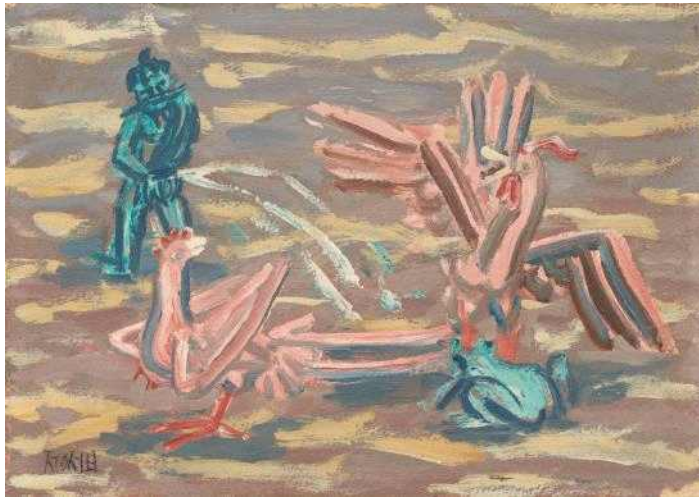
이중섭, 오줌싸개와 닭과 개구리, 1950년대 전반, 종이에 유채, 28×40cm, 국립현대미술관 이건희컬렉션