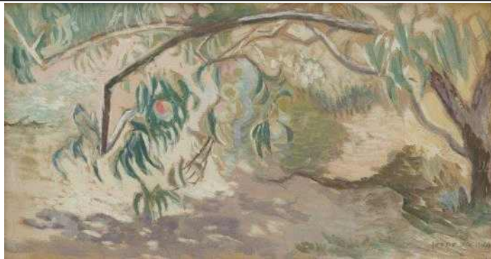
이인성, 복숭아 나무, 1935, 종이에 수채, 30.5×53cm, 국립현대미술관 이건희컬렉션