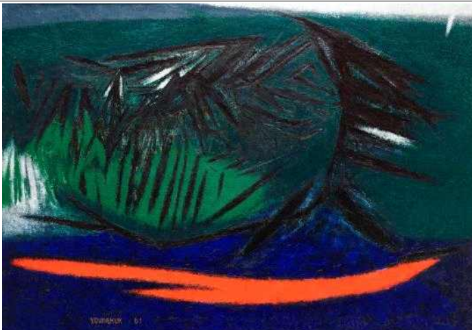
유영국, 산, 1961, 캔버스에 유채, 136.5×194.5cm, 국립현대미술관 이건희컬렉션