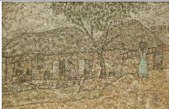
박수근, 농촌풍경, 1960년대, 캔버스에 유채, 22×34.5cm, 국립현대미술관 이건희컬렉션, ©박수근연구소