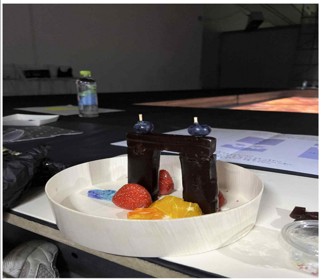
다문화어린이 요리워크숍 보석연못 화채 완성(후)