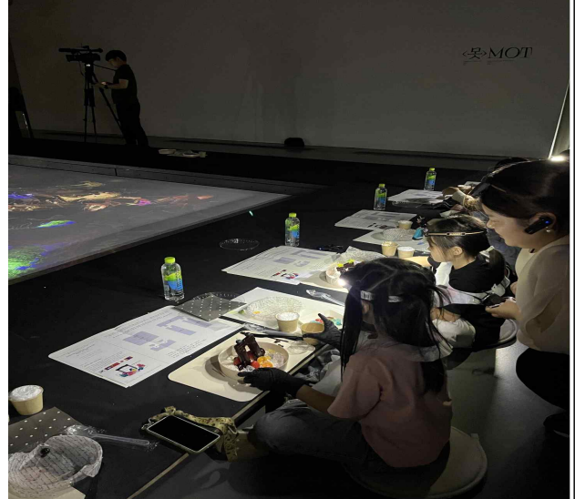
다문화어린이 요리워크숍 보석연못 화채 만들기