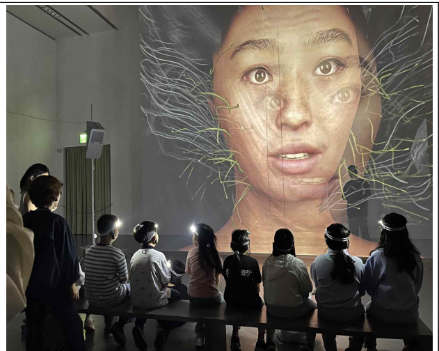
다문화어린이 워크숍 알루작가와 전시투어